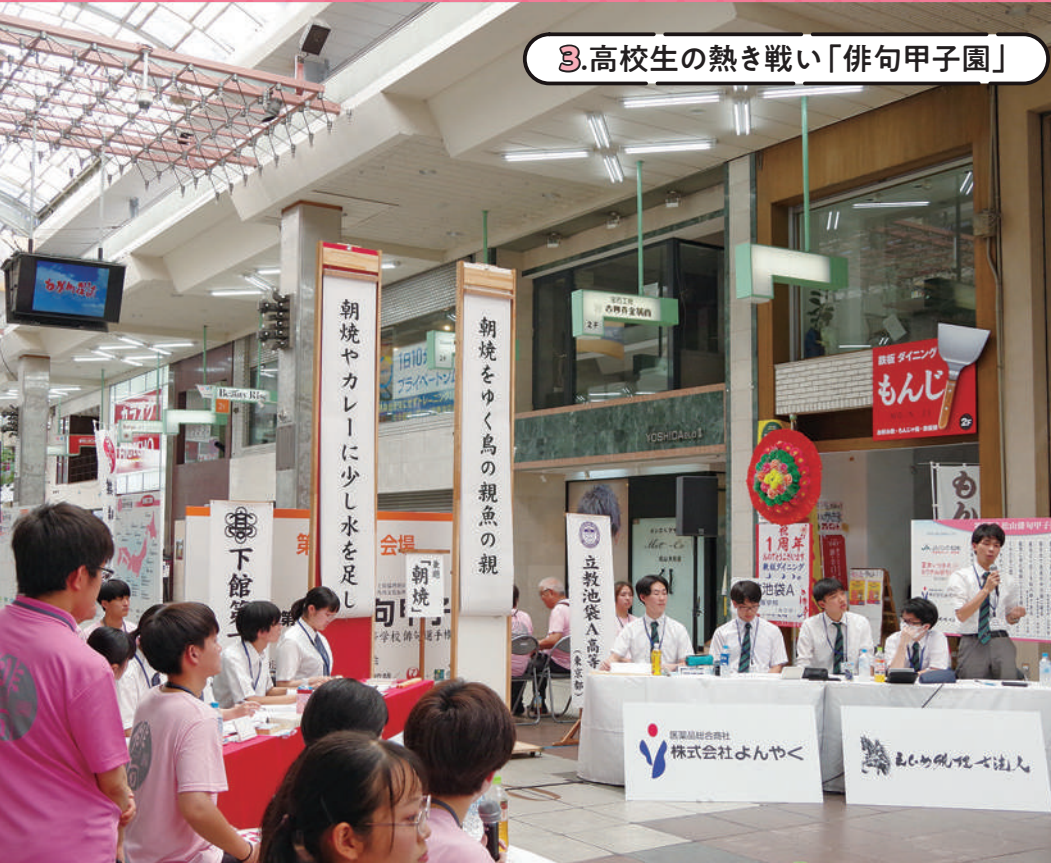
3.高校生の熱き戦い「俳句甲子園」