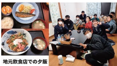
地元飲食店での夕飯